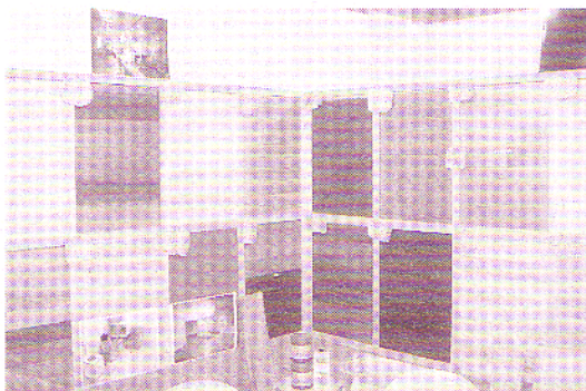
女性も入りやすいムクフローリングショールーム